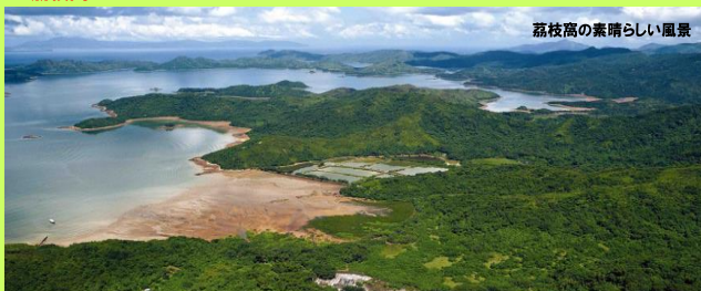
荔枝高の素晴らしい風景

香港北方の自然林の残る里山を楽しみながら歩いて300年の歴史を持つ香港最古の客家村荔枝高へ。そこで風水林や見事な集合住宅、そして銀葉樹の森を楽しみます。帰りは裏山から山を越えて出発地点に戻ります。