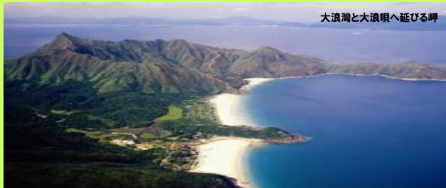
大浪湾と大浪嶼へ延びる岬

山頂からは沖合はるかに点在する西貢諸島が眺め渡せます。この島々はかつてこのシャープピークに続く連山でした。下山は南の大湾へ、峠を越えて赤徑へ向かいそこからフェリーで黄石埠頭へ戻ります。山は険しく健脚向きです。