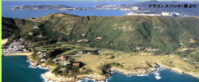
ドラゴンズバック・東より

アジアのハイキングコース・ナンバーワンに選定されたこともある極めつけのコース。香港トレイル最終セクション8にあたります。バス停から40分ほど登れば左右を海に挟まれた稜線の上に飛び出し、まさに天上散歩が楽しめます。