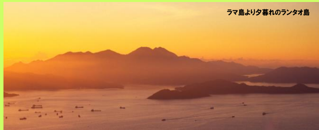
ラマ島より夕暮れのランタオ島

香港最大の島はランタオ島。そのほとんどは山岳地帯で平均高度は400m。その中で鳳凰山と大東山は抜きん出て高い2つの盟主です。鳳凰山は香港では日の出を見る第一の名所で、日本の富士山のようなものです。それを一気に登ると言う大変意欲的なコース。ただし途中で疲れたようであればバスで下山することも可能です。チャレンジのつもりで出かけたらいかがでしょうか。